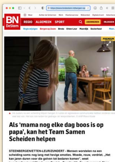
Artikel samen Scheiden BN de Stem (augustus 2021) → Bekijk het artikel