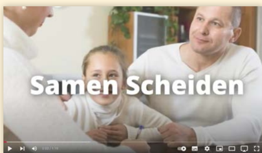
Filmpje over Antoinette over aanpak Samen Scheiden → Bekijk de video