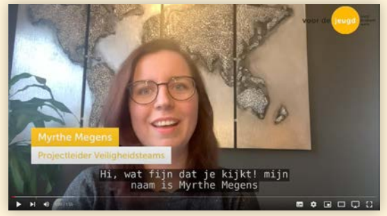
Filmpje over hoe Veiligheidsteams werken → Bekijk de video