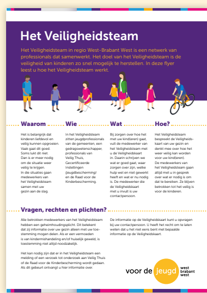
Folder veiligheidsteams → Bekijk de pdf

"Een doorontwikkeling van de veiligheidsteams is de nieuwe pilot van de proeftuin voor de jeugdbescherming. Ook zou ik graag zien dat we meer doen met volwassenenproblematiek en conflictueuze echtscheidingen. Daarnaast zou ik graag meer ondersteuning willen voor de werkers bij inzet van gespecialiseerde hulpverleners voor volwassenenproblematiek."